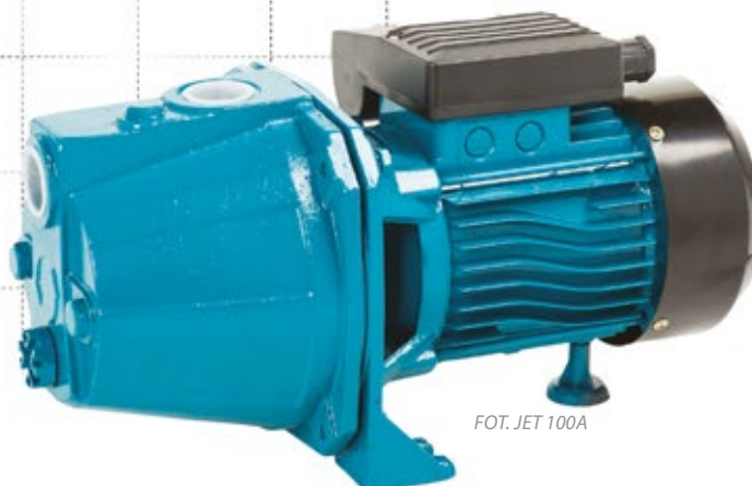
FOT. JET 100A