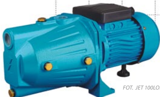
FOT. JET 100LONG