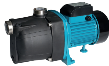
JSW 150 GARDEN

Jednostopniowa, samossąca, odśrodkowa pompa powierzchniowa, wyposażona w układ podnoszący zdolność zasysania, dzięki zastosowaniu tuby Venturiego. Przeznaczona do pompowania czystej, zimnej wody z własnych ujęć oraz podnoszenia ciśnienia. Pompy znajdują zastosowanie przy zaopatrywaniu w wodę domów, działek rekreacyjnych oraz przy nawodnieniach.