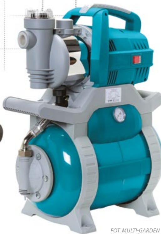
FOT. MULTI-GARDEN KOMPLETNÍ HYDROFOROVÁ SOUPRAVA

Samonasávací odstředivé čerpadlo s vestavěným síťovým filtrem, vybavené zařízením zvětšujícím sací hloubku díky použití Venturiho trubice. Tělo čerpadla je vyrobeno z kvalitní hmoty a nerezové oceli. Čerpadlo je vybaveno vypínačem vestavěným do krytu a rukojetí pro snadnou manipulaci. Motor čerpadla je vybaven tepelnou ochranou. Čerpadlo je rovněž dostupné s příslušenstvím, hydroforovými soupravami a hydroforovými automaty.